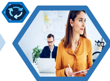
PEQUEÑOS NEGOCIOS SIEMPRE CONECTADOS (ALWAYS-ON)

Disfrute de una instalación sencilla y servicios de TI fiables mediante la tecnología en la nube.