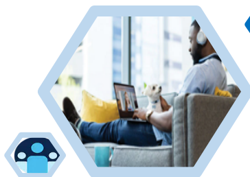
TRABAJANDO DESDE CASA (WFH)

Su pequeña empresa es nuestra gran prioridad. Contamos con soluciones simples para resolver problemas complejos. A través de la tecnología Cisco fortalecemos su negocio hoy y lo ayudarlo a prepararse para el mañana.